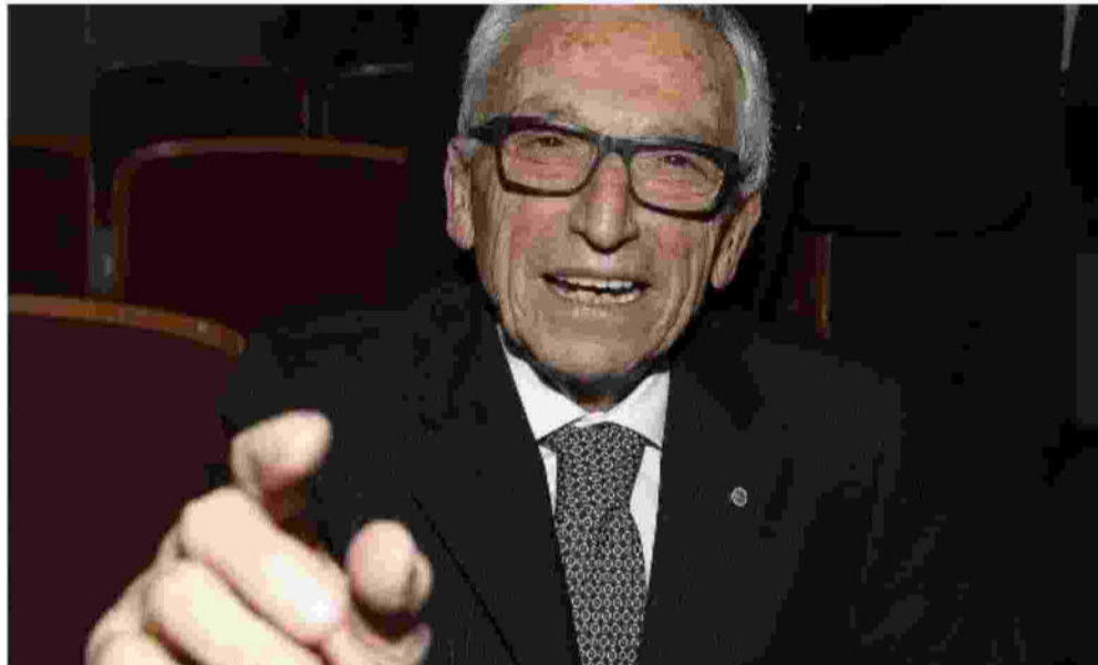
Il dito puntato verso il prossimo, che è un po' anche l'espressione del genio: sotto con Marco Minniti, ex ministro degli Interni, a destra con lo chef Cracco, sopra in compagnia dell'ex governatore delle Marche Luca Ceriscioli

Non tutte rose e fiori anche perché la famiglia, aumentando la popolarità, venne presa di mira da alcuni banditi sardi per una possibile estorsione. Venne fatta anche esplodere una rudimentale bomba nel garage della loro abitazione a Ginestreto.